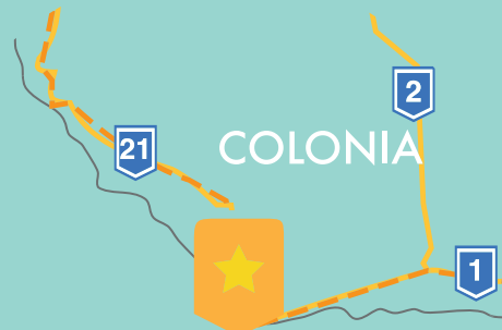
Barrio Histórico Colonia del Sacramento